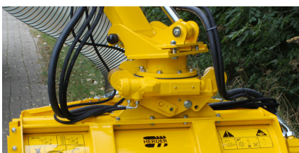
Hydraulische draaikop 180° d.m.v. een wormwieldraaikrans met mechanische pendel (HWP180).