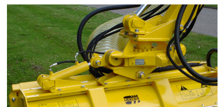
Hydraulische draaikop 180° d.m.v. een wormwieldraaikrans met hydraulische pendel (HWHP180).