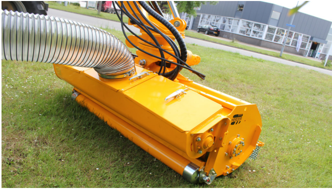
Vijzelbakunit voor grasafvoer door middel van afzuiging.