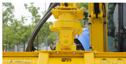
Hydraulische draaikop 180° d.m.v. een wormwieldraaikrans met hydraulische pendel d.m.v. een draaicilinder (HWHZ180).