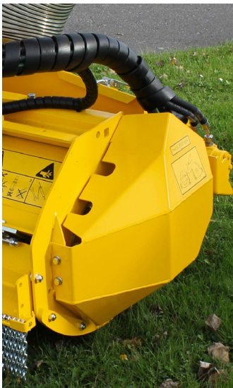
Optionele motorbescherming en optionele hydraulisch opklapbarevoorzijde voor betere invoer van hoog gewas.