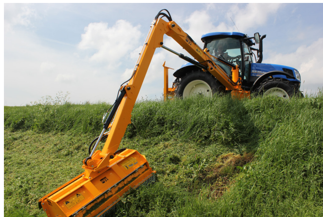
Ecomaaiër aan een Herder Cavalier.

De ecomaaiër is bijzonder geschikt voor het onderhouden van ruige begroeiingen zoals wegbermen. De ecomaaiër maait het gewas door middel van een ronddraaiende rotor met daaraan 'los' hangende klepels bevestigd. Door de snel ronddraaiende klepels wordt de begroeiing afgeslagen en meegenomen door de klepels waarna het aan de achterzijde van de maaikap uitgeworpen wordt.