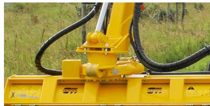
Hydraulische draaikop 180 graden d.m.v. een wormwieldraaikrans (HW180).