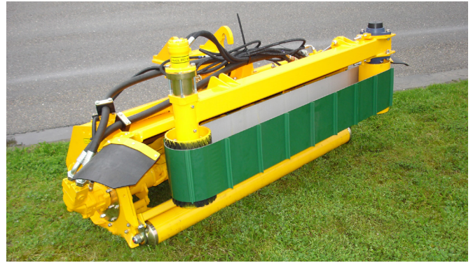
Transportbandunit in zware uitvoering voor grasafvoer bij het maaien van o.a. sloten en taluds.