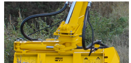
Hydraulische draaikop 180° d.m.v. een cilinder (HD180).