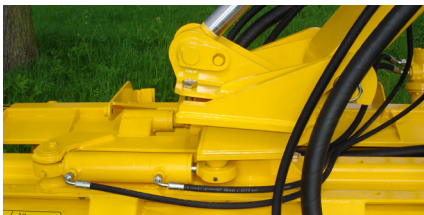
Hydraulische draaikop 90° d.m.v. een cilinder (HD90).