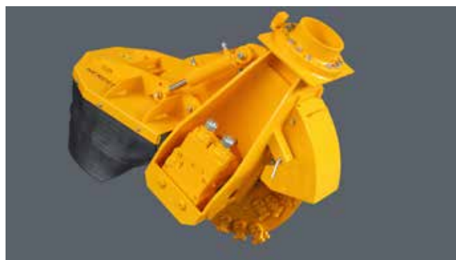
SCE-800H in basisuitvoering voor oliestroom tussen 80 en 160 l/min

De SCE-800H is de grootste stobbenfrees uit deze serie. De SCE-800H is uitgerust met een freeswiel met een diameter van 80 cm (89 cm met beitels). Deze Herder-Fermex wordt standaard geleverd met een mechanisch verstelbare hydraulische motor. Daarmee is deze stobbenfrees geschikt voor elke hydraulische kraan met een oliestroom tussen de 80 en 160 L/min (max. 420 Bar) en te gebruiken voor de meeste kranen tussen de 10 en 20 ton.