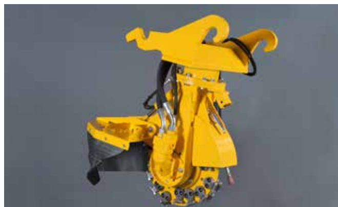
SCE-550H met verachttert snelwissel CW 20-40 voor 80 l/min

De SCE-550H is de middelste stobbenfrees uit deze serie. Deze uitvoering is geschikt voor de meeste kranen tussen de 7 en 14 ton. De SCE-550H is uitgevoerd met een freeswiel met een diameter van 55 cm (64 cm met beitels). De machine heeft een hydraulische motor met een oliestroom tussen de 60 en 80 L/min (max 350 Bar).