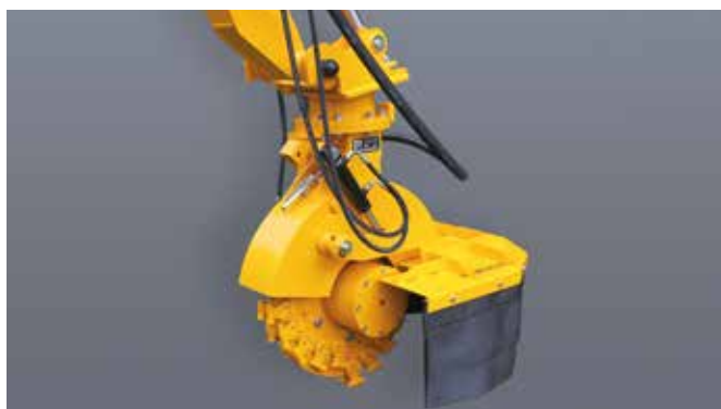
SCE-630H in basisuitvoering voor max. oliestroom van 110 of 150 l/min

De SCE-630H is de middelste stobbenfrees uit deze serie. Deze uitvoering is geschikt voor de meeste kranen tussen de 10 en 20 ton. De SCE-630H is uitgevoerd met een freeswiel met een diameter van 63 cm (72 cm met beitels). U heeft de keuze uit twee hydraulische motoren. Zo kunt u kiezen uit een motor voor een oliestroom tussen de 80 en 110 L/min (max 350 Bar) of tussen de 110 en 150 L/min (max 350 Bar).