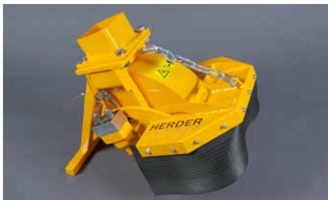
SCE-410H in basisuitvoering voor max. oliestroom van 40 of 50 l/min

De SCE-410H is de kleine stobbenfrees uit deze serie. Deze uitvoering is geschikt voor de meeste kranen tussen de 3 en 8 ton. De SCE-410H is uitgevoerd met een freeswiel met een diameter van 41 cm (50 cm met beitels). U heeft de keuze uit twee hydraulische motoren. Zo kunt u kiezen uit een motor voor een oliestroom tussen de 30 en 40 L/min (max 350 Bar) of tussen de 40 en 50 L/min (max 350 Bar).