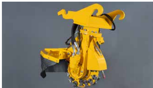
SCE-550H mit verachtet Schnellwechsel CW 20-40 für 80 l/min

Die SCE-550H ist die mittelgroße Stubbenfräse aus dieser Serie. Diese Ausführung ist für die meisten Bagger zwischen 7 und 14 Tonnen geeignet. Die SCE-550H ist mit einem Fräserad mit einem Durchmesser von 55 cm (64 cm mit Zähnen) ausgestattet. Die Maschine hat einen Motor mit einem Öldurchfluss von 60 bis 80 l/min (max. 350 bar).