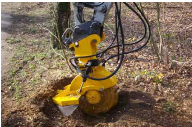
Hydraulisch verstellbaren Späneschutz beim SCE-410H (Optional)