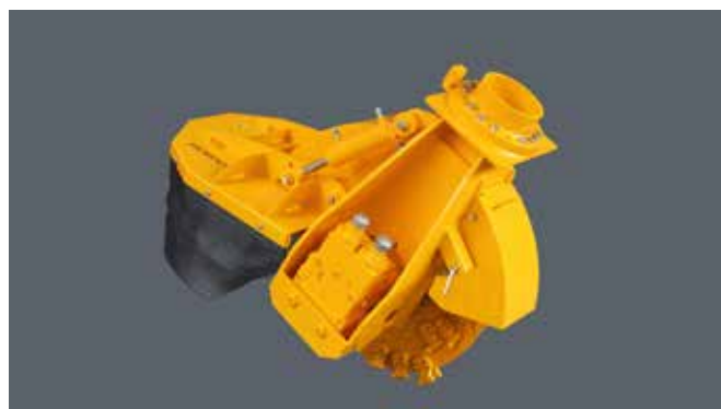
SCE-800H in Basisausstattung für Ölmenge zwischen 80 und 160 L/min

Die SCE-800H ist die größte Stubbenfräse aus dieser Serie. Die SCE-800H ist mit einem Fräserad mit einem Durchmesser von 80 cm (89 cm mit Zähnen) ausgestattet. Die Maschinen werden standardmäßig mit einem mechanisch einstellbarem hydraulik Motor geliefert. Sie sind für jeden Hydraulik-Bagger mit einem Öldurchfluss von 80 bis 160 l/min (max. 420 bar) geeignet und können für die meisten Bagger mit einem Gewicht von 10 bis 20 Tonnen verwendet werden.