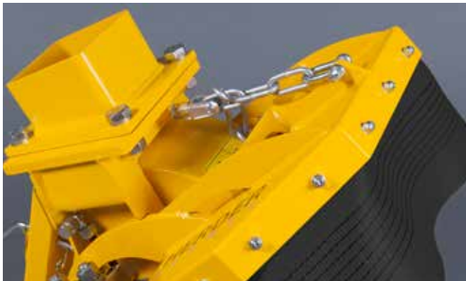
Mechanisch verstellbarer Späneschutz beim SCE-410H (Standard)

Die SCE-410H ist standardmäßig mit einem mechanisch verstellbaren Späneschutz. Eine andere Wahl ist die SCE-410H mit einem hydraulisch verstellbaren Späneschutz auszustatten, die SCE-550H, die SCE-630H und die SCE-800H hingegen sind standardmäßig mit einem hydraulisch verstellbaren Späneschutz ausgestattet. Hierdurch können Sie - als Bediener - aus der Kabine Ihres hydraulischen Baggers den Späneschutz so positionieren, dass jederzeit die maximale Sicherheit und Abschirmung garantiert ist.