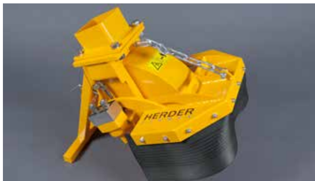
SCE-410H in Basisausstattung für max. Ölmenge 40 oder 50 l/min

Die SCE-410H ist die kleinste Stubbenfräse aus dieser Serie. Diese Ausführung ist für die meisten Bagger zwischen 3 und 8 Tonnen geeignet. Die SCE-410H ist mit einem Fräserad mit einem Durchmesser von 41 cm (50 cm mit Zähnen) ausgestattet. Sie können zwischen zwei hydraulischen Motoren wählen, einem Motor mit einem Öldurchfluss von 30 bis 40 l/min (max. 350 bar) oder einem Motor mit einem Öldurchfluss von 40 bis 50 l/min (max. 350 bar).