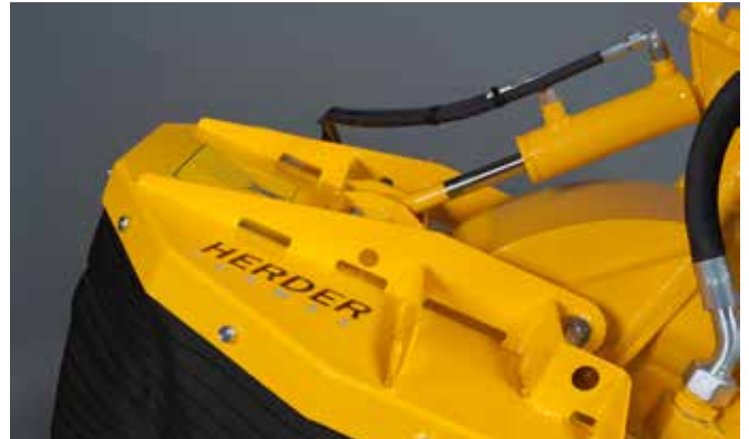
Hydraulisch verstellbarer Späneschutz beim SCE-550H , SCE-630H und SCE-800H (Standard)