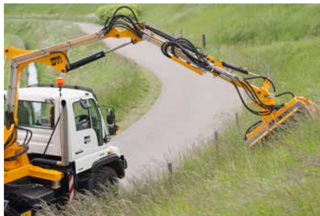
Links oder rechts in einem Bereich von 7 Metern arbeiten