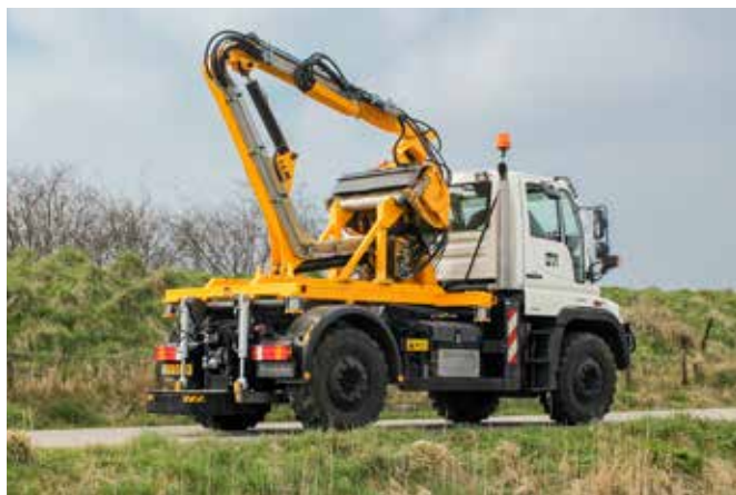
De Musketier-Y im Transportzustand

Der Musketier-Y wird standardmäßig mit einem zweiteiligen Auslegersatz geliefert. Die Maschine hat dadurch einen Bereich von ca. 7 Metern von der Mitte der Maschine aus gemessen. Arbeiten können sowohl links, als auch rechts von der Maschine aus durchgeführt werden. Hier haben Sie immer eine gute Übersicht über die ausgeführten Arbeiten. Der Maschinist verfügt außerdem über den Komfort von Nivotronic.